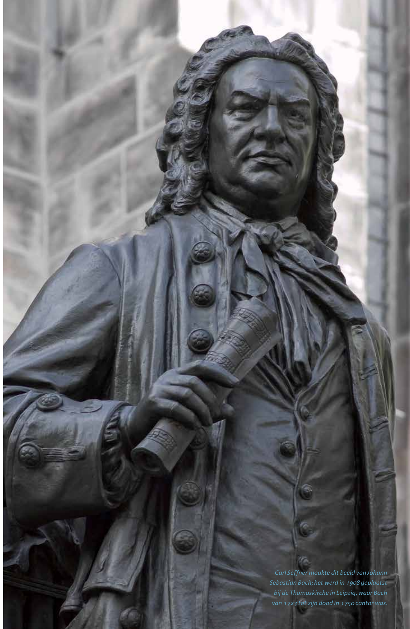
Carl Seffner maakte dit beeld van Johann Sebastian Bach; het werd in 1908 geplaatst bij de Thomaskirche in Leipzig, waar Bach van 1723 tot zijn dood in 1750 cantor was.