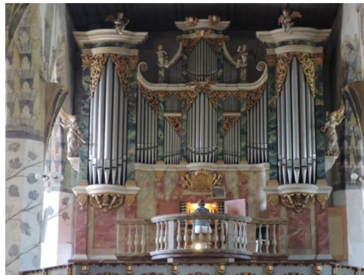
Het Hildebrandt-orgel in Sangerhausen.

Deze experimenten betreffen de kern van het plan. Die kern is dat we een orgel willen bouwen dat geheel klinkt en 'voelt' als een orgel dat de Duitse orgelmaker Zacharias Hildebrandt, een goede bekende van Johann Sebastian Bach, in het Orgelpark gebouwd zou kunnen hebben. We kopiëren dus niet een van zijn orgels; we reconstrueren zijn manier van werken. De termen die in de internationale orgelwereld voor zo'n dergelijke werkwijze worden gebruikt zijn verhelderend. We willen om te beginnen Hildebrandts 'pattern language' leren verstaan, dus de patronen volgens welke hij werkte en dacht; we willen zijn idioom als het ware leren spreken. Aan de hand van de kennis die dat oplevert, willen we vervolgens tot een 'process reconstruction' komen, dus het proces van Hildebrandts werkwijze reconstrueren.